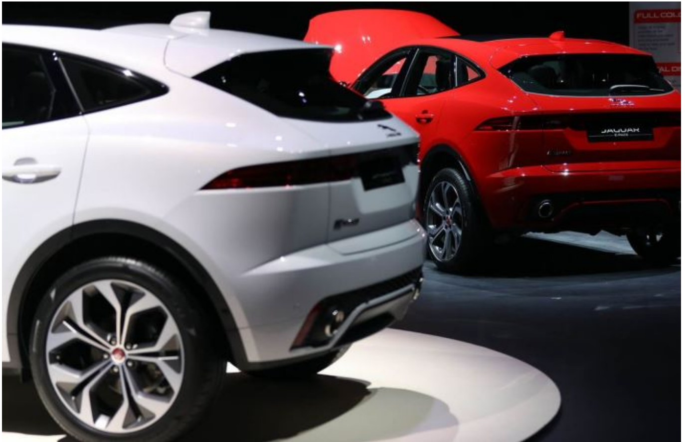
Jaguar Land Rover. foto bloomberg.

“Tata Motors siapkan 397,6 miliar rupee ($ 6,1 miliar) tunai sejak akhir Juni. Ini perusahaan India terbesar kedua yang tercatat, mengikuti Reliance Industries Ltd,” jelas C Ramakrishnan melalui email awal bulan ini.